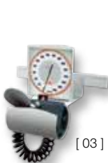
[ 03 ]