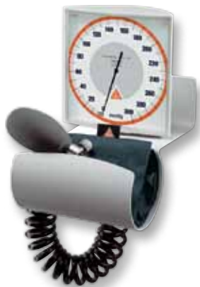
[ 01 ]