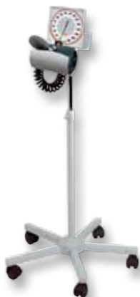
[ 02 ]